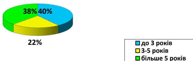
Рис. 2. Структура порушень вуглеводного обміну у хворих на хронічний панкреатит

менша кількість ПВО в післяопераційному періоді, ніж у хворих з анамнезом понад 1 рік (p=0,02). Тому нами запропоновано політику ранньої хірургічної інтервенції – до розвитку незворотних функціональних порушень, які призводять до ендокринної або екзокринної недостатності.